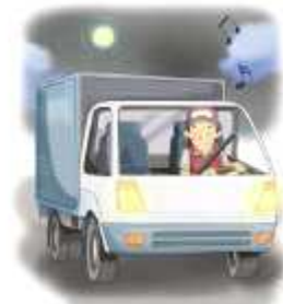
신호 및 속도 준수