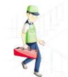
난간 손잡이를 잡고 안전하게 이동