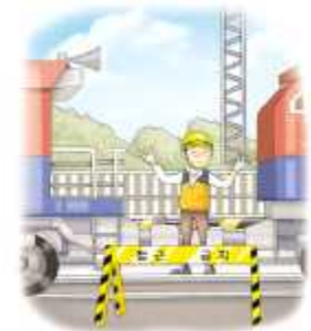
입환작업 시 출입금지 표지판 설치