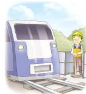
작업자 대피공간 확보