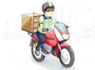
보호구는 반드시 착용