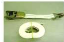
화물 결속기(갈갈이바) 사용