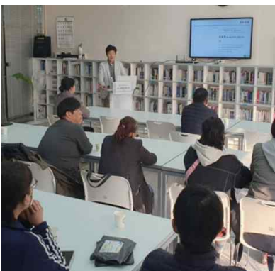
산업안전 컨설턴트 교육